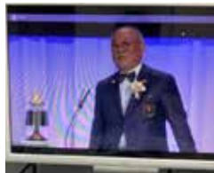
ガバナー福原有一

13:00開会点鐘 ガバナー福原有一 国家斉唱/ロータリーソング THE LEGEND 13:20RI会長代理挨拶・現況報告 14:20地区内参加クラブ紹介(動画) 15:00記念講演 元内閣総理大臣小泉純一郎氏 16:15記念コンサート THE LEGEND 16:50RI会長代理講評・ガバナー謝辞・閉会点鐘