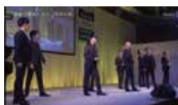
記念コンサート THE LEGEND