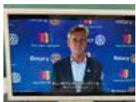
RI会長よりメッセージ